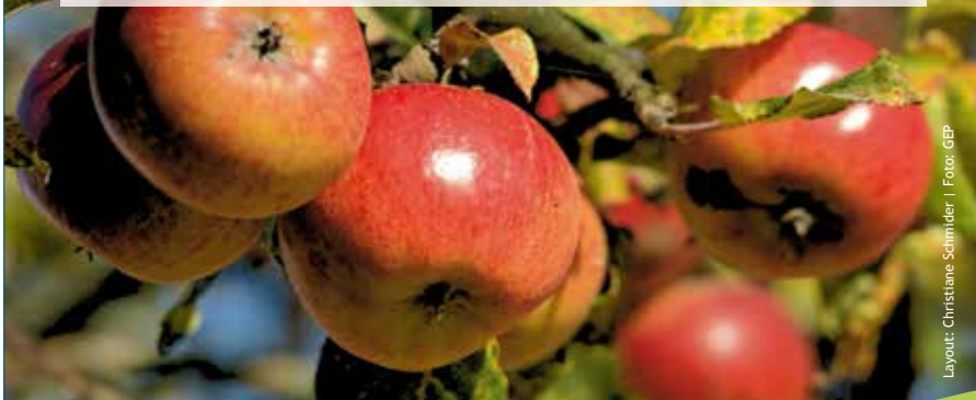
Layout: Christiane Schmäder

Musik: Christiane Bergsträsser, KonfiBand mit Bernd Rechenbach