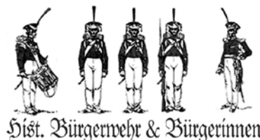
Hist. Bürgerwehr & Bürgerinnen