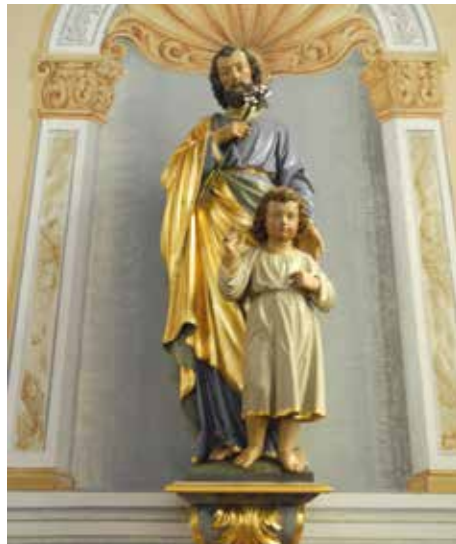
Foto: Heiliger Josef