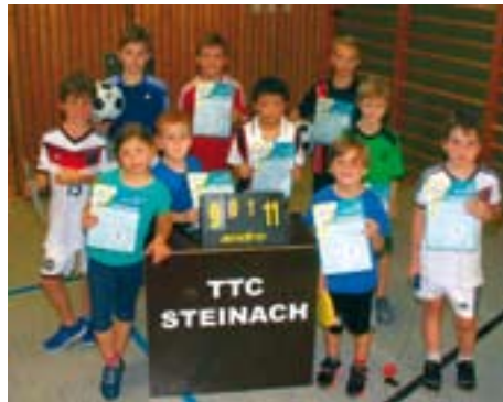
Die Teilnehmer der Mini-Meisterschaften 2014

Der TTC kann wieder junge Talente in sein Montagstraining für die Jüngsten aufnehmen und freut sich auf neue Mitglieder.