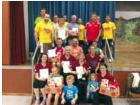
Die Teilnehmer des Ewald-Roser-Turniers 2014

Der TTC Steinach bedankt sich an dieser Stelle bei allen teilnehmenden Mannschaften für das gute Gelingen des Turniers und hofft, dass auch im nächsten Jahr alle Mannschaften wieder tatkräftig am Turnier teilnehmen werden.