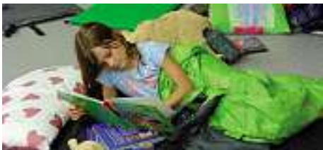
Lesenacht 2. Klasse

Wenn es mal wieder nachts im Schulhaus laut wird, kann es sich wohl nur um eine Lesenacht handeln. Die Zweitklässler der Fritz-Ullmann-Grundschule waren nach den Drittklässlern an der Reihe. Sie übernachteten von Montag auf Dienstag in der Schule. Zuerst war die Lesefähigkeit bei einer Pausenhof- und Spielplatzrallye gefragt. Mit viel Freude wurden die Aufgaben gelöst. Als Belohnung gab es für jeden ein Eis. Anschließend wurde ein Film geschaut, gespielt und zum Schluss noch eine Runde im Schlafsack gelesen. Nach und nach schliefen alle ein. Morgens um 6.00 Uhr waren die ersten Schülerinnen schon wieder munter. Das Frühstück wurde gerichtet. Es wurde ausgiebig gefrühstückt, bevor es mit Aufräumen und Unterricht weiterging. Die Kinder waren sich einig, dass auch im nächsten Schuljahr mindestens eine Lesenacht auf dem Programm stehen muss.