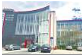
Zu Hause ist IMA Immobilien im Nestler-Carrée in Lahr.

Die Vielzahl an Angeboten auf dem Immobilienmarkt verunsichert Interessenten. Mit IMA Immobilien aus Lahr als Partner können sie sich ein konkretes Bild ihrer Wunschimmobilie machen. Faktoren wie Lage, Beschaffenheit oder Attraktivität des Objekts überprüft das Team, das aus absoluten Profis besteht, sehr genau