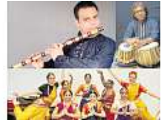
Krishna & the Gopis

Samstag, 11. Mai Refektorium Altes Kapuzinerkloster Haslach Beginn: 18 Uhr Eintritt: 15,00 € Abendkasse 12,00 € Vorverkauf per E-Mail: juliahoppe@posteo.de