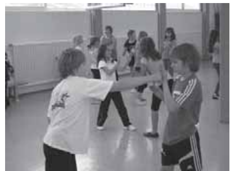
Voll konzentriert. Schüler in Aktion