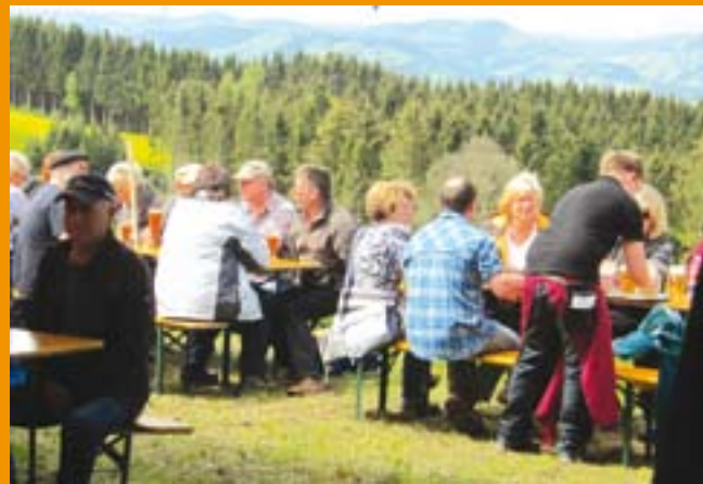
Maifest auf den Nillhöfen

1. Mai und Sie wissen nicht wohin? Im Kinzigtal ist an diesem Tag viel geboten.