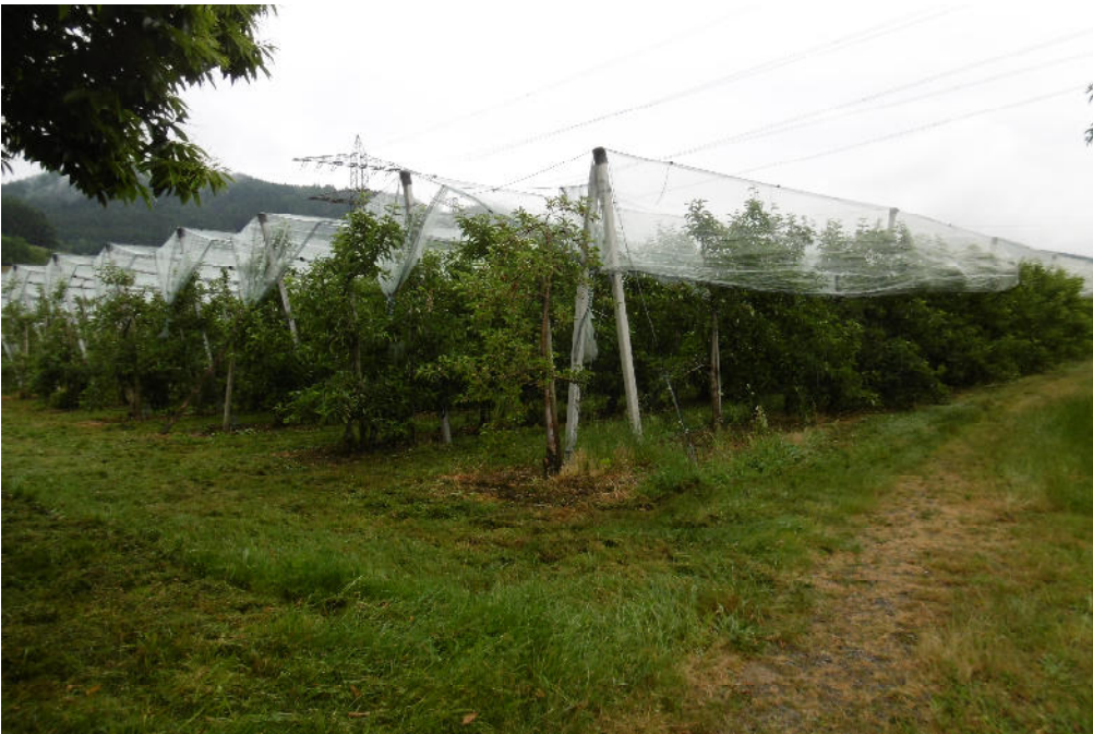
Abb. 2 Obstanlage