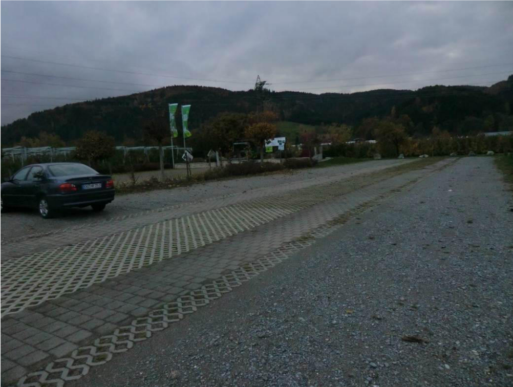
Abb. 1 Bestehende Parkplatzfläche