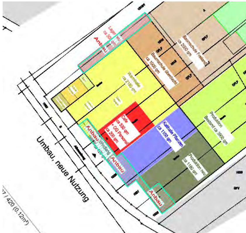
Abbildung 2: Übersicht zu den geplanten Anbauten (türkis schraffierte Fläche)

Der Einfluss der geplanten Maßnahme auf die Hochwasserrückhaltung wurde untersucht. Dazu wurde das Volumen des verdrängten Wassers auf dem Grundstück des Gartencenters ermittelt. Maßgebend für die Ermittlung des verdrängten Wasservolumens waren ausschließlich die in Abbildung 2 dargestellten (türkis schraffierten) Anbauten.