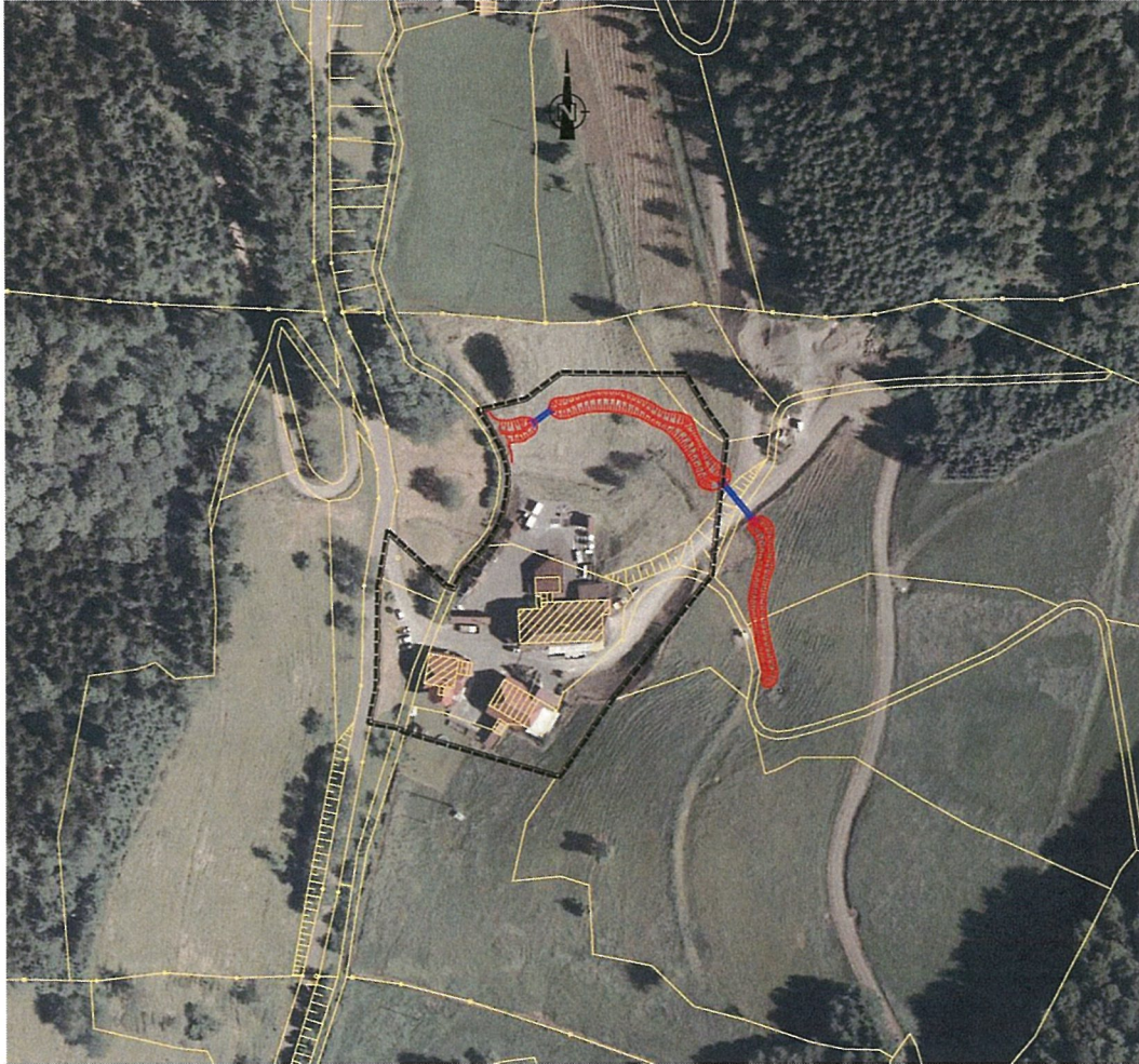
Abb.1: Lage des Baugebiets

Natur- und Landschaftsschutzgebiete, Naturdenkmale, regional bedeutsame Biotope, FFH- oder Vogelschutzgebietes bzw. Flächen, die diesbezüglich die fachlichen Meldekriterien erfüllen, sind von der Aufstellung des Bebauungsplanes nicht betroffen oder vorhanden.