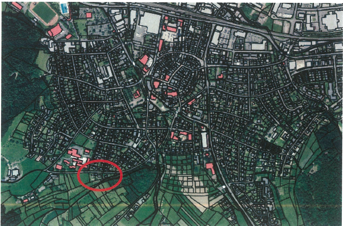
Standort und Lage des Planungsgebiets im Stadtgefüge

Das Grundstück Flst. Nr. 2549 liegt im Geltungsbereich des Teilbebauungsplanes „Breite“ aus dem Jahre 1957, wobei aber lediglich der Baulinienplan mit den Baulinien und Baugrenzen Rechtskraft besitzt. Im Übrigen beurteilt sich das Bauvorhaben gemäß § 34 Baugesetzbuch danach, ob es sich in die Umgebungsbebauung einfügt.