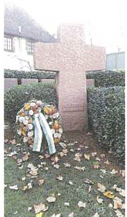
Philipp Saar Bürgermeister