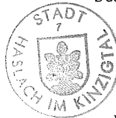
[Handwritten signature] Winkler Bürgermeister